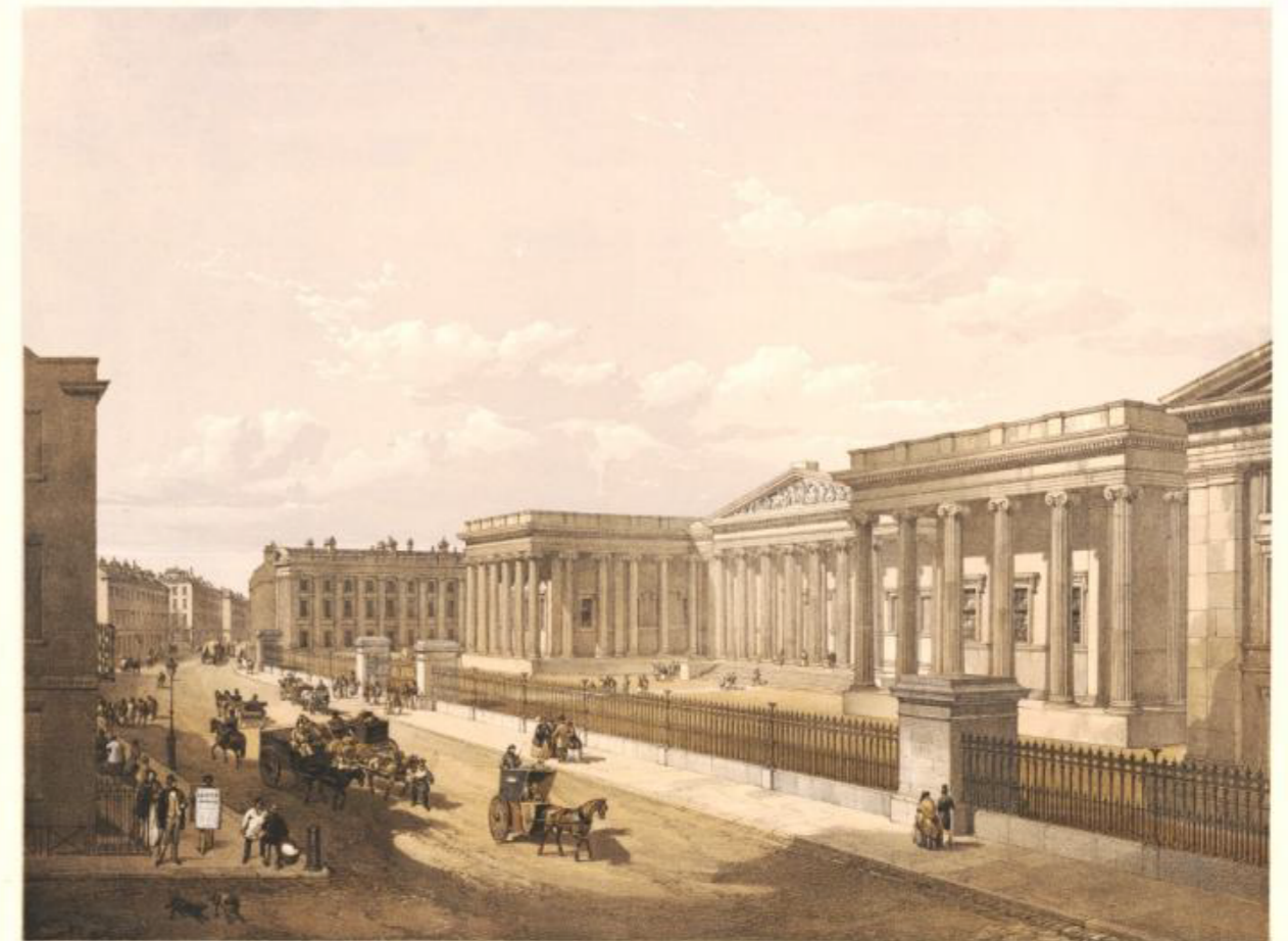
THE BRITISH MUSEUM.

Gradualmente, el museo se volvió verdaderamente abierto y de libre acceso para todos y ahora damos la bienvenida a más de 6 millones de visitantes locales e internacionales al museo cada año.